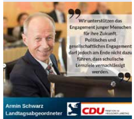
Armin Schwarz Landtagsabgeordneter